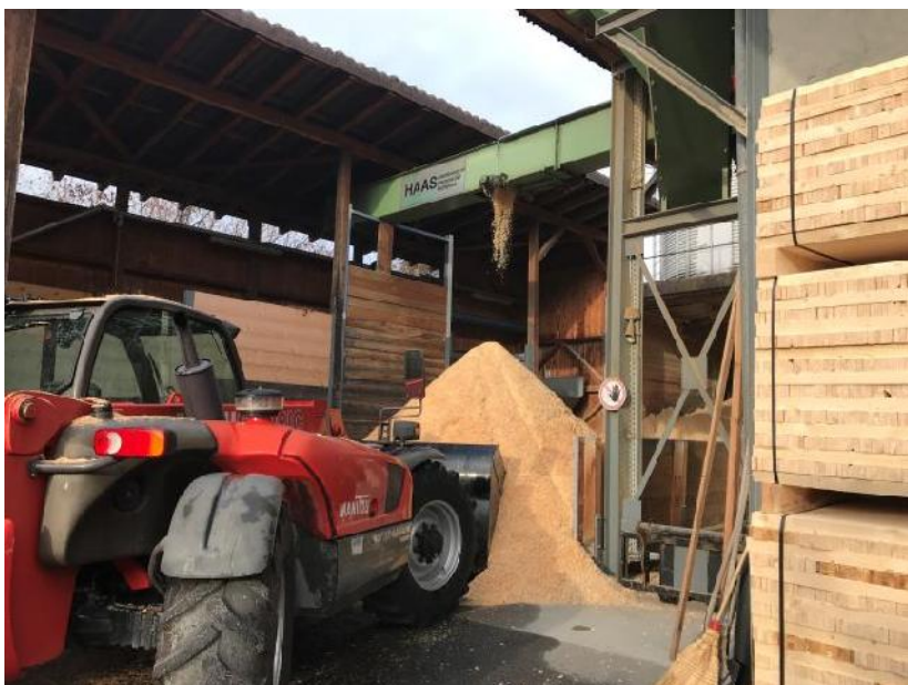
7. Afin d'être plus écologiques et compétitifs, les déchets sont réutilisés pour l'alimentation de la chaudière et vendus pour la fabrication de pellets (Valpellet).