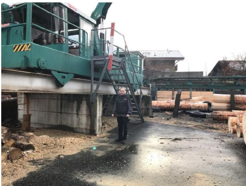
6. Thierry Premand se tient devant le chariot de débitage avec tronçonnage et marquage des pièces.