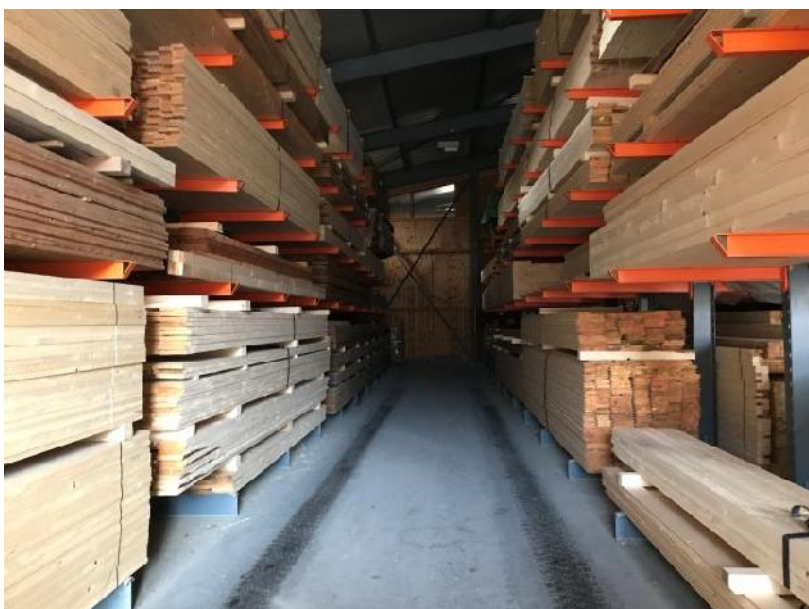
8. La halle de stockage accueille le bois déjà traité et prêt à la vente.