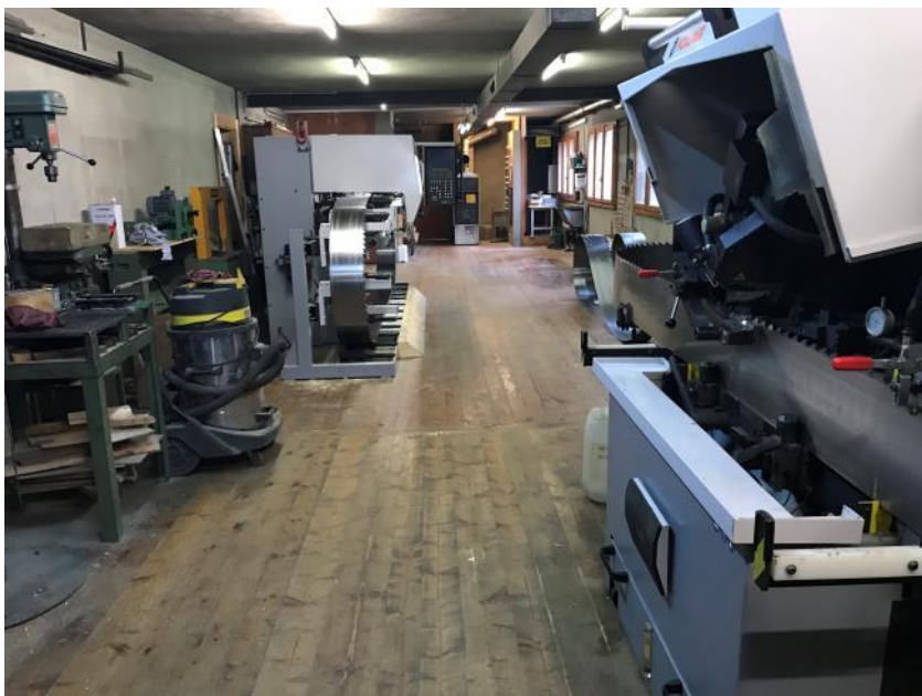
9. Salle d'affûtage des lames de la scie.